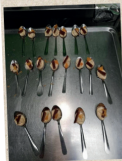
Dégustation des enfants !